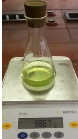
Abb. 2 - Gewicht und Färbung nach der Reaktion

Deutung: Bei dieser Reaktion erfolgt eine Neutralisation, die unter Wärmeabgabe von Statten geht. Es läuft die folgende Reaktion ab: