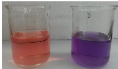
Abb. 1 - Färbungen des Universalindikators: rechts Salzsäure, links Natronlauge.

Durchführung: In jeweils ein Becherglas wird 50 mL Salzsäure bzw. Natronlauge und Universalindikator (Mengenangabe siehe Indikator) gegeben. Das Gewicht des Becherglasinhalts wird bestimmt. Anschließend werden beide Flüssigkeiten in den Erlenmeyerkolben überführt und dieser schnell verschlossen. Das Gewicht wird erneut bestimmt.