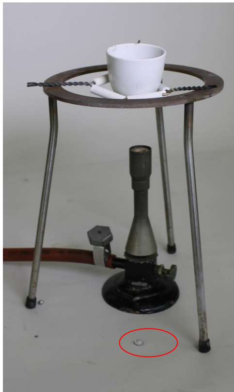
Abb. 1 - Versuchsaufbau Aluminiumrecycling.

Beobachtung: Die Schmelze ist klar. In dem Schmelzkuchen befindet sich das Aluminium, das zu einem handlichen Klumpen zusammengeschmolzen ist.