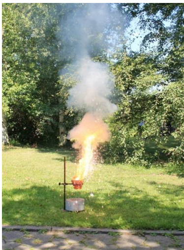
Abbildung 1 zeigt die Reaktion von Eisenoxid mit Aluminium. Stellt in Zweiergruppen eine Hypothese für die Reaktion von Eisenoxid mit Aluminium auf. Welche Produkte erwartet ihr? Plant ein Experiment zur Überprüfung eurer Hypothese.