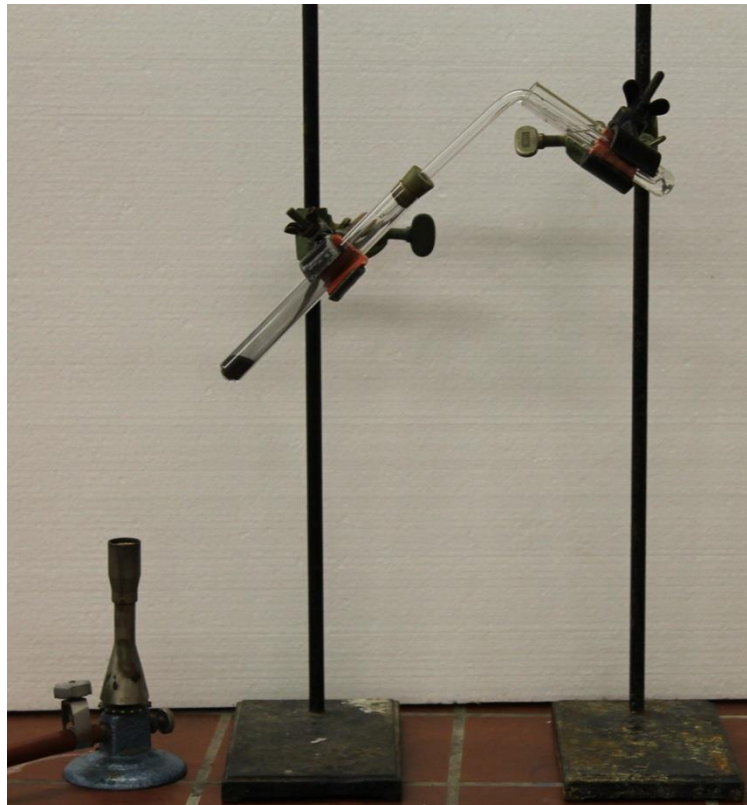
Abb. 2 - Versuchsaufbau Ötzis Beil.

Beobachtung: Das Gemisch glüht orange-rot auf. Das entstehende Gas trübt das Kalkwasser. In dem Reagenzglas ist nach dem Abkühlen ein schwarz-grauer Feststoff mit rötlichen Stellen zu erkennen.