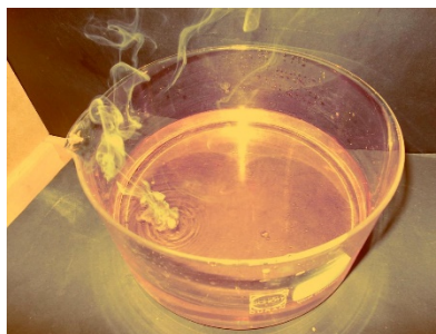
Abb. 1 - Tanzendes Natriumstück auf dem Wasser, das pinke Schlieren hinterlässt.

Deutung: Natrium reagiert heftig mit Wasser unter Bildung eines Gases. Die Verfärbung des Indikators zeigt an, dass sich der pH-Wert der Lösung verändert hat, der pH-Wert liegt im basischen Bereich.