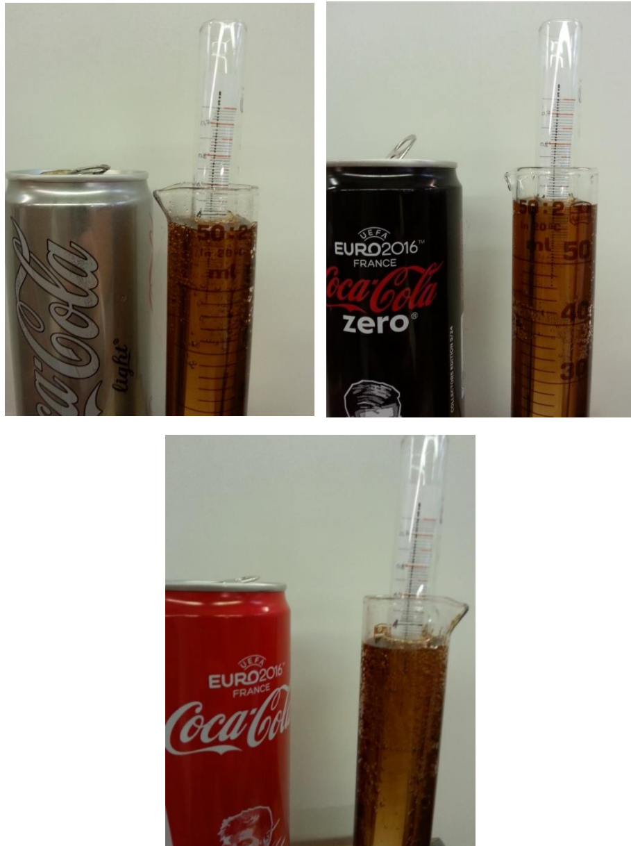
Abb. 3 – Messungen der Dichte von Zuckerlösungen mit Aräometer CocaCola light (oben links), CocaCola Zero (oben rechts) und CocaCola (unten).

Beobachtung: Die „normale“ CocaCola hat eine höhere Dichte als Wasser, nämlich ungefähr 1,05. Bei den anderen beiden Zuckerlösungen ist die angezeigte Dichte minimal kleiner als 1.