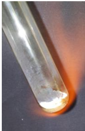
Abbildung 1 – Erhitzen von Silberoxid.

Beobachtung: Nach einiger Zeit verfärbt sich das Pulver und wird weiß. Nach langer Zeit (einige Minuten) des Erhitzens sind silbrige Rückstände zu erkennen.