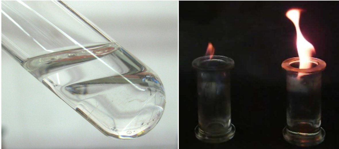
Abb. 9 – Unterschiedliche Dichten von Pentan und Paraffin (links) bzw. Methan und Butan (rechts).

Deutung: Pentan hat eine signifikant niedrigere Dichte als Paraffin und bildet daher, obwohl beide Stoffe unpolar sind, eine getrennte Phase über dem Paraffin. Butan hat mit 0,60 \text{ g/cm}^3 eine höhere Dichte als Methan ( 0,42 \text{ g/cm}^3 ) und ist schwerer als Luft. Daher bleibt Butan auch im geöffneten Standzylinder am Boden des Zylinders und verbrennt dort, während Methan, welches leichter als Luft ist, aufsteigt und über dem Zylinder verbrennt.