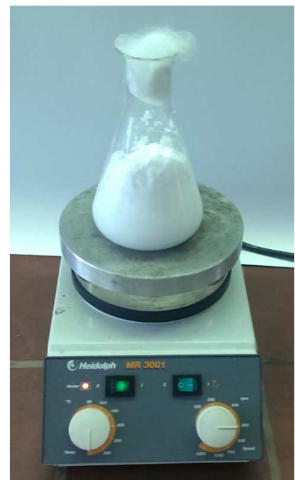
Abb.5 - Aufkochen der übersättigten Natriumacetat-Lösung

Deutung: Durch die Erwärmung liegt Natriumacetat-Trihydrat im „Ladungs-Zustand“ vor und die Kristallisation des Salzes bleibt bei vorsichtiger Handhabung aus. Erst durch ein Anstoßen wird dieser Zustand gestört.