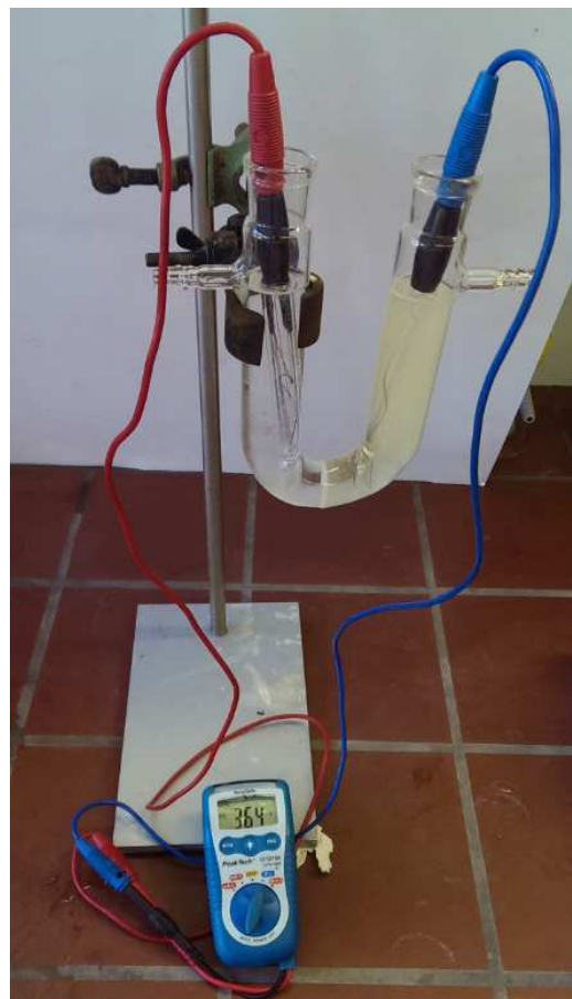
Abb.6 - Die Glucosebrennstoffzelle

Durchführung: 20 mL Wasserstoffperoxid werden mit 80 mL Kalilauge zusammengegeben und anschließend in einem Eisbad herunter gekühlt. Ist diese Lösung herunter gekühlt, wird eine zweite Lösung, bestehend aus 10 g Glucose und 90 g Kalilauge hergestellt. Von beiden Lösungen wird nun die gleiche Menge in je einen Schenkel des U-Rohrs gegeben. Die Elektroden werden in die Lösung eingetaucht und die Spannung mit einem Multimeter gemessen.