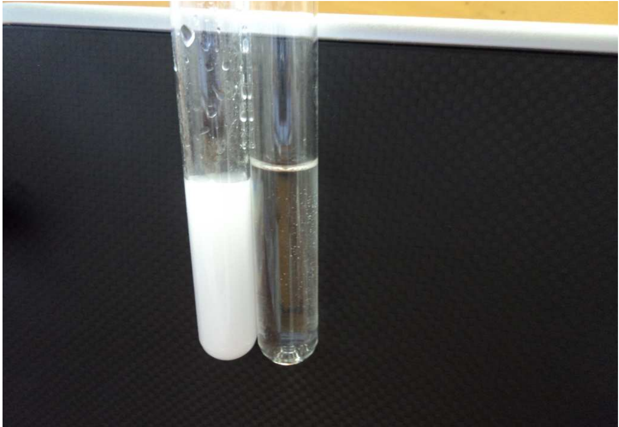
Abbildung 1: Calciumcarbonatniederschlag vor und nach Zugabe der Citronensäure. Links: vor der Zugabe ist der Niederschlag deutlich zu erkennen, rechts: nach der Zugabe hat er sich aufgelöst.

Deutung: Calciumchlorid reagiert mit Natriumcarbonat zu Calciumcarbonat. Dieser Niederschlag wird durch Zugabe von Citronensäure wieder aufgelöst, da die Säure mit den Calciumionen einen stabilen Komplex bildet.