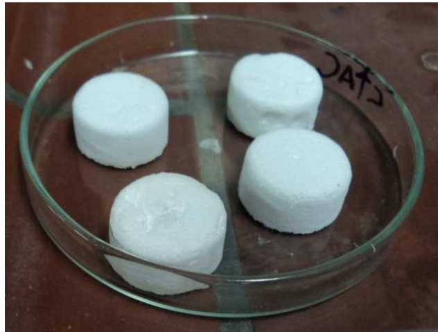
Abb. 1 - Aussagekräftige Skizze oder Foto.

Deutung: Das aufgesogene Gas enthält zum Teil Wasserstoff, der vorher in den Silikonschwämmen gespeichert war. Wird dieser in die Seifenlauge gepustet, entstehen mit Wasserstoff gefüllte Seifenblasen. Diese zerplatzen, wenn sie in die Nähe von Feuer kommen und eine Knallgasreaktion läuft ab. Da die Menge an Wasserstoff pro Seifenblase jedoch sehr gering ist, ist die Reaktion eher gemäßigt.