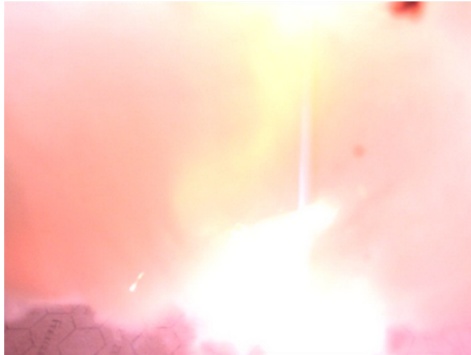
Abb. 1 - Lichtblitz