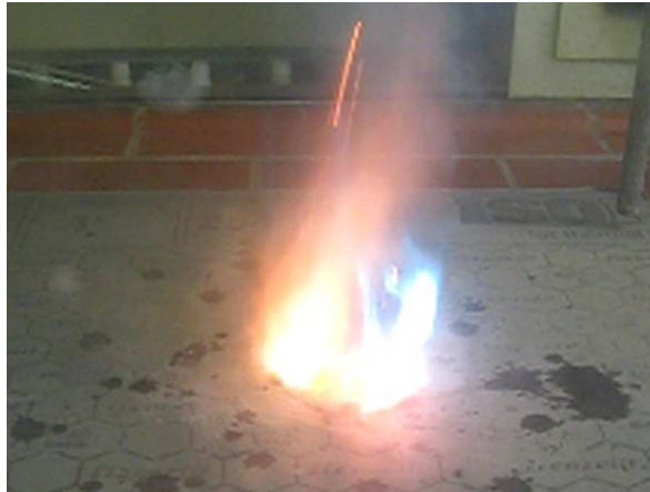
Abb. 2 – Magische Flamme