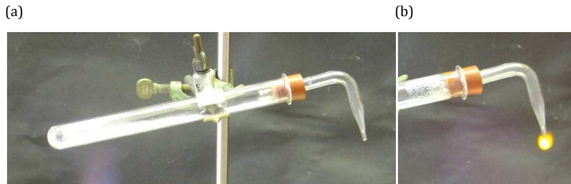
Abb 3: Darstellung (a) und Entzündung (b) von Methan

Deutung: Das entzündete Gas beweist, dass durch das Erhitzen von Natriumacetat mit Natriumhydroxid Methan entsteht: