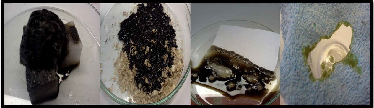
Abb. 5 – Der Einfluss von Schwefelsäure auf Kohlenhydrate

Deutung: Die Hygroskopische Wirkung der Schwefelsäure entzieht den Kohlenhydraten das Wasser, wodurch die Struktur zerstört wird. Der kleinste Baustein dieser organischen Substanzen ist der Kohlenstoff, der anhand der charakteristischen Farbe leicht erkannt werden kann.