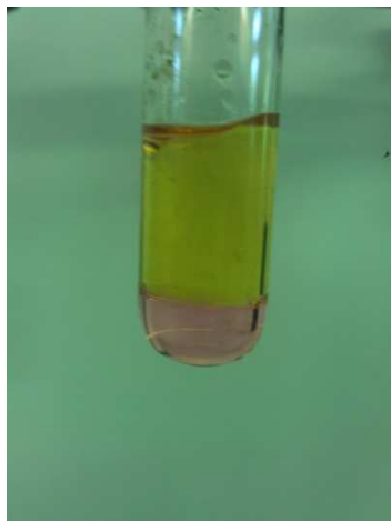
Abbildung 1: Die untere Chloroform-Phase ist durch elementares Iod violett verfärbt.

Beobachtung: Die Chloroformphase färbt sich violett.