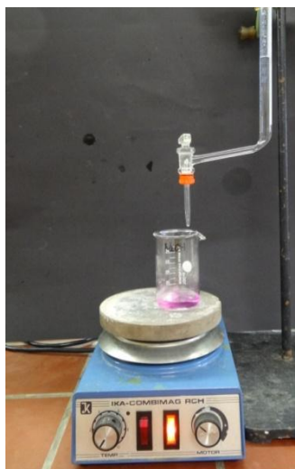
Abbildung 1: Versuchsaufbau für die Titration von Natronlauge mit Schwefelsäure.

Beobachtung: Nach dem Zutropfen von 20 mL Schwefelsäure entfärbte sich die Lösung. Nach dem Eindampfen bleibt ein weißer, kristalliner Rückstand zurück.