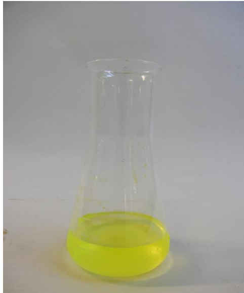
Abb. 1 Calciumchloridlösung mit Fluorescein-Farbstoff. Die Fluoreszenz der Lösung ist deutlich erkennbar.