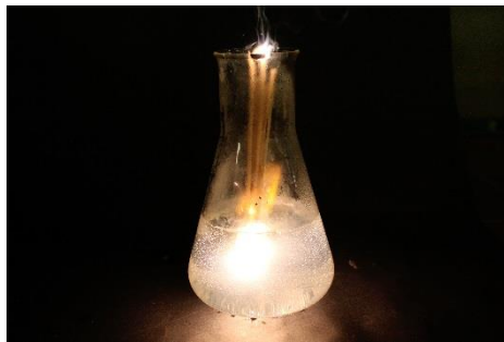
Abb. 1: Magnesium brennt unter Wasser.

Beobachtung: Das Magnesium brennt mit heller Flamme unter Wasser weiter.