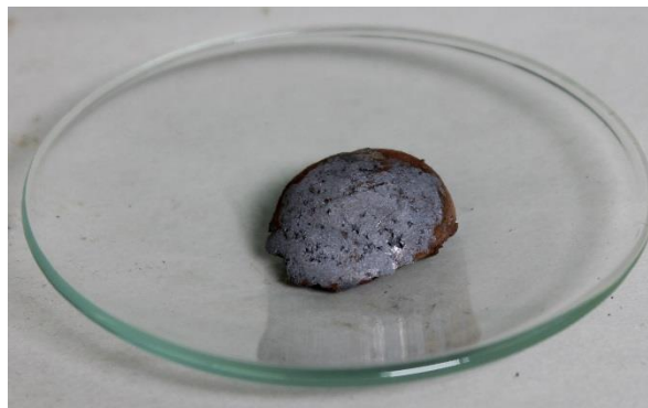
Abb. 1: Bronze nach der Reaktion von Kupfer und Zinn.

Beobachtung: Es entsteht ein gold-silberner Feststoff.