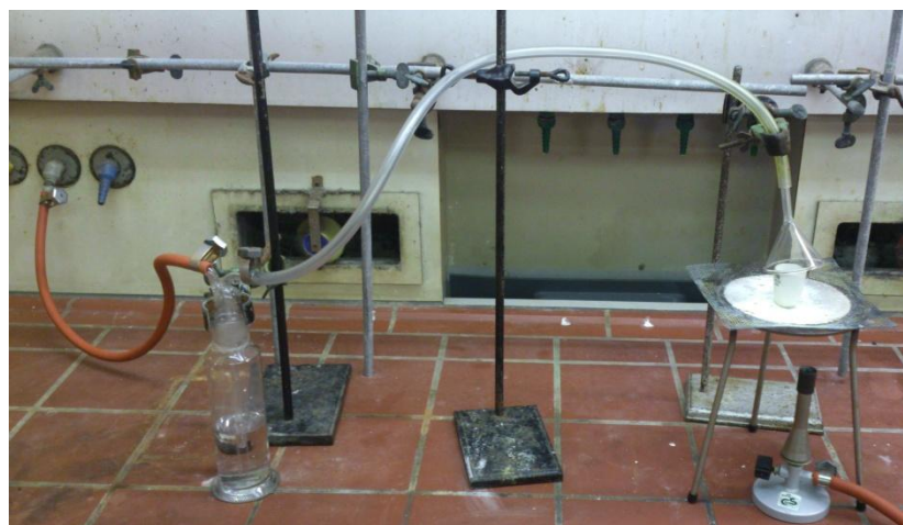
Abb. 5 - Apparatur zur Verbrennung von Schwefel mit Kaliumnitrat.

Durchführung: Der detaillierte Aufbau der Apparatur ist Abbildung 5 zu entnehmen. In den Porzellantiegel werden etwa fünf Spatelportionen Kaliumnitrat gegeben und eine Spatelportion Schwefel hinzugefügt. Die Waschflasche wird zu einem Drittel mit Bariumchlorid-Lösung gefüllt, Vakuum wird gezogen und der Tiegel wird so lange mit starker Flamme erhitzt, bis eine starke Verbrennung einsetzt.