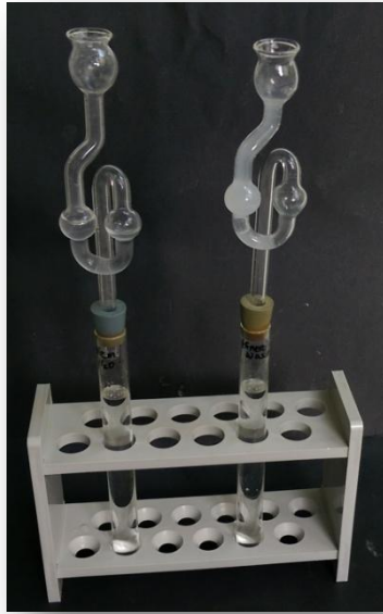
Abbildung 1: Das demin. Wasser mit dem Gärröhrchen mit Calciumhydroxid-Lösung (links) und das Reagenzglas mit Mineralwasser und einer getrübbten Calciumhydroxid-Lösung (rechts).

Deutung: Im Mineralwasser ist Kohlensäure enthalten, die mit Hilfe vom ausfallenden Calciumcarbonat nachgewiesen werden kann. Die Reaktionsgleichung lautet: