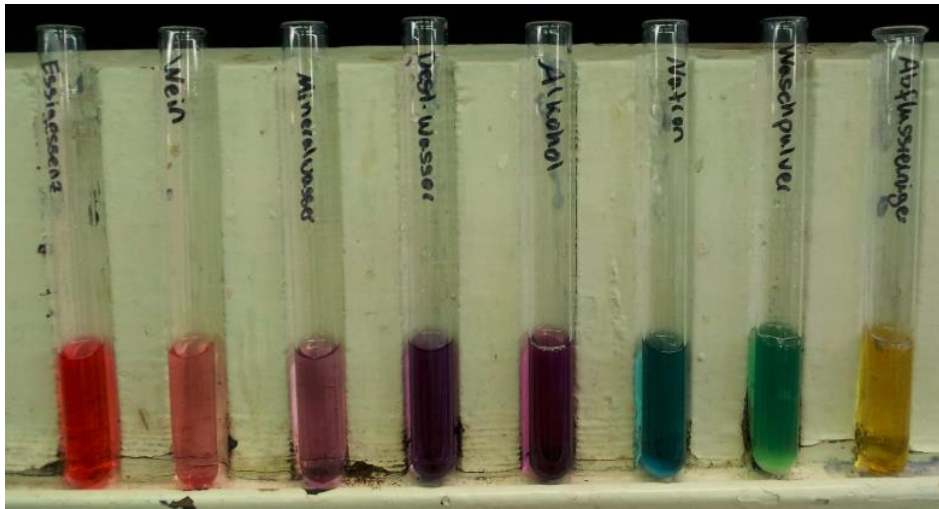
Abbildung 1 - Farborgel mit Alltagschemikalien

Deutung: Rotkohl verändert je nach pH-Wert die Farbe. Dadurch kann man ihn gut als Indikator verwenden. Hierbei können alle pH-Wert-Bereiche abgedeckt werden (von sauer bis basisch). Die unterschiedliche Farbigeit kommt durch die Änderung der chemische Struktur des Farbstoffes in protonierter bzw. deprotonierter Form vor. Stark saure Substanze werden intensiv rot gefärbt (Abbildung 5, linker Bereich). Neutrale Chemikalien besitzen eine blau-violette Farbe. Stark basische Chemikalien, wie Rohrreiniger, sind leuchtend gelb gefärbt. Abstufungen im basischen Bereich bilden sich von blau über grün bis zu gelb, je nach Basenstärke (Abbildung 5, rechter Bereich).