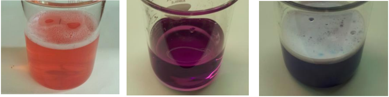
Abbildung 1 links: Färbung direkt nach Tablettenzugabe, Mitte: Farbveränderung zu blau-violett, rechts: es stellt sich nach 19-15 min eine dunkelblaue Färbung ein.

Deutung: Die Erklärung der Farbveränderung ergibt sich aus der Zusammensetzung der Reinigungstablette. Zunächst überwiegt die Wirkung der sich gut lösenden Säuren (Citronensäure, Maleinsäure und Amidoschwefelsäure). Nach der Freisetzung von Kohlenstoffdioxid aus den Salzen Carbonat und Hydrogencarbonat und von Sauerstoff aus dem Monosulfat und dem Perborat ist die Lösung dann annähernd neutral.